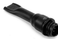
图 4 终止端