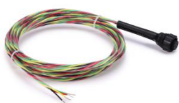
图 2 引出线