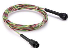
图 3 跳接线