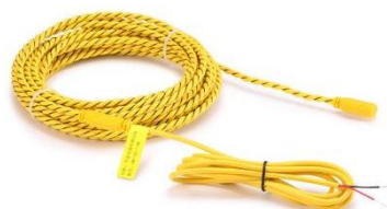
图 3 固定式感应线（出厂前已连接）