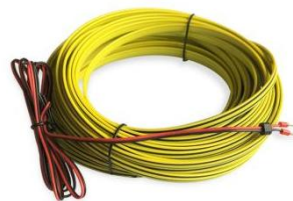
图 3 固定式感应线（出厂前已连接）