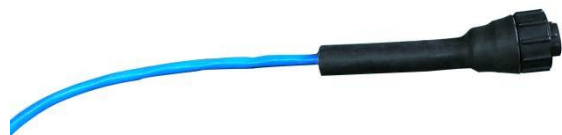
图 2 分体式感应线引出线（需另外采购）